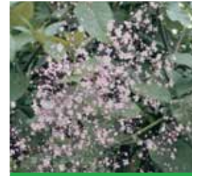
Thalictrum delavayi Wiesenraute

Blüthenhöhe: 100-120 cm Blütezeit: Juli-Sept, R*