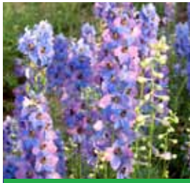
Delphinium x elatum 'Ouverture' Rittersporn

Blüthenhöhe: 100-120 cm Blütezeit: Sept-Okt