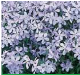
Phlox divaricata 'Clouds of Perfume' Wald-Flammenblume

Blüthenhöhe: 30-40 cm Blütezeit: Juli-Aug