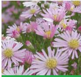
Aster pringlei 'Pink Star' Myrten-Aster

Blüthenhöhe: 100-120 cm Blütezeit: Sept-Okt