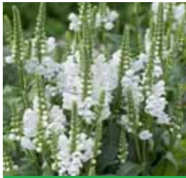
Physostegia virginiana 'Alba' Gelenkblume

Blüthenhöhe: 25-30 cm Blütezeit: Mai-Juni