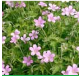
Geranium endressi Storchschnabel

Blüthenhöhe: 60-80 cm Blütezeit: Juni-Juli, R*