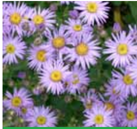
Aster amellus 'Glücksfund' Sommer-Aster

Blüthenhöhe: 120-180 cm Blütezeit: Juli-Sept