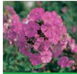
Phlox paniculata 'Düsterlohe' Flammenblume

Blüthenhöhe: 100-120 cm Blütezeit: Juli-Sept, R*