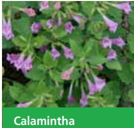
Calamintha grandiflora Großblütige Bergminze

Blüthenhöhe: 50 cm Blütezeit: Juni-Aug, R*