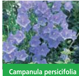
Campanula persicifolia 'Grandiflora Coerulea' Pfirsichblättrige Glockenblume

Blüthenhöhe: 50 cm Blütezeit: Juni-Aug, R*