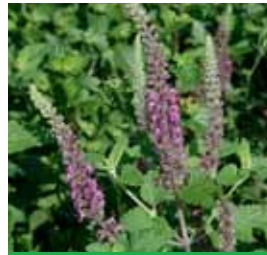
Teucrium hyrcanicum 'Paradise Delight' Gamander