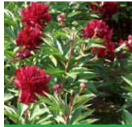
Paeonia lactiflora 'Jessie' Pfingstrose

Blüthenhöhe: 160 cm Blütezeit: Juni-Sept, R*