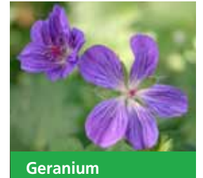
Geranium wlassovianum 'Lakwijk Star' -R- Storchschnabel

Blüthenhöhe: 40-60 cm Blütezeit: Juni-Aug