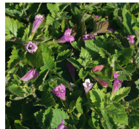
Calamintha grandiflora Bergminze

Blütenhöhe: 50 cm Blütezeit: Juni-Aug., R*