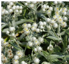
Anaphalis triplinervis Perlkörbchen

Blütenhöhe: 120-180 cm Blütezeit: Juli-Sept