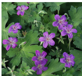
Geranium wlassovianum Storachschnabel

Blütenhöhe: 40-60 cm Blütezeit: Juli-Aug