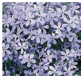
Phlox div. 'Clouds of Perfume' Wald-Flammenblume

Blütenhöhe: 30-40 cm Blütezeit: Juli-Aug