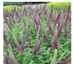
Teucrium hyrcanicum 'Paradise Delight' Gamander