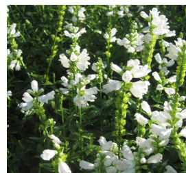
Physostegia virginiana 'Alba' Gelenkblume

Blütenhöhe: 25-30 cm Blütezeit: Mai-Juni