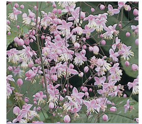
Thalictrum delavayi Wiesenraute

Blütenhöhe: 80-100 cm Blütezeit: Juli-Sept, R*