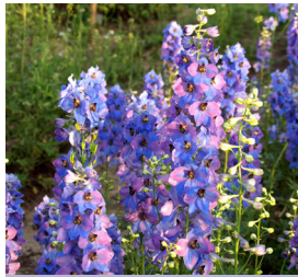
Delphinium elatum , hellblau Rittersporn

Blütenhöhe: 100-120 cm Blütezeit: Sept-Okt