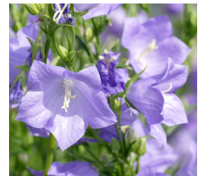
Campanula persicifolia 'Grandiflora Coerulea' Glockenblume

Blütenhöhe: 50 cm Blütezeit: Juni-Aug., R*