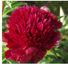
Paeonia lactiflora , rot gefüllt Pfingstrose

Blütenhöhe: 160 cm Blütezeit: Juni-Sept, R*