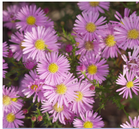
Aster pringlei 'Pink Star' Myrten-Aster

Blütenhöhe: 100-120 cm Blütezeit: Sept-Okt