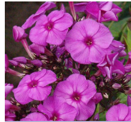
Phlox paniculata , purpur Flammenblume

Blütenhöhe: 80-100 cm Blütezeit: Juli-Sept, R*