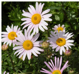
Arctanthemum arcticum 'Roseum' Margerite

Blütenhöhe: 20-25 cm Blütezeit: Juli-Aug