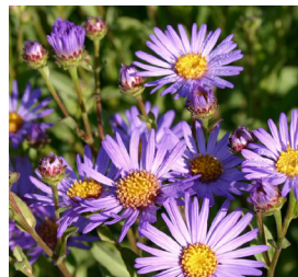
Aster amellus , blau Myrten-Aster