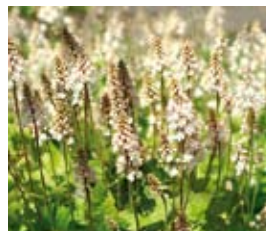
Tiarella cordifolia Herzblättrige Schaumblüte