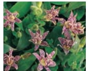
Tricyrtis hirta Japan-Krötenlilie