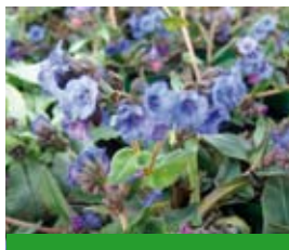
Pulmonaria dacica 'Blue Ensign' Schmalblättriges Lungenkraut