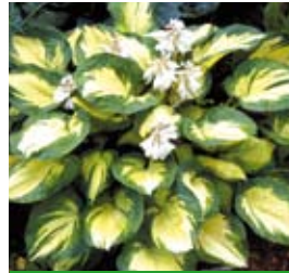
Hosta sieboldiana 'Great Expectations' Funkie