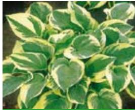
Hosta x hybr. 'Wide Brim' Blaue Gelbrand-Funkie