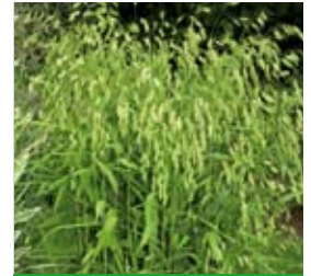
Chasmanthium latifolium Plattährengras