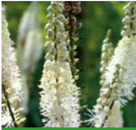
Cimicifuga rac. var. cordifolia 'Blickfang' Silberkerze