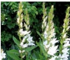
Campanula latifolia var. macrantha 'Alba' Wald-Glockenblume

Blütenhöhe: 100 cm Blütezeit: Jun-Jul, R*