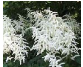
Astilbe x japonica 'Deutschland' Pracht-Spiere