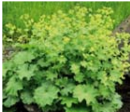
Alchemilla mollis Frauenmantel