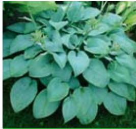
Hosta x plantaginea 'Fragrant Blue' Blaublättrige Funkie