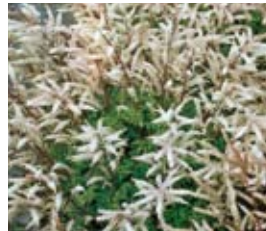
Aruncus aethusifolius Zwerg-Geißbart