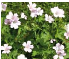
Geranium x oxonianum 'Rohina Moss' Storchschnabel

Blütenhöhe: 100 cm Blütezeit: Jun-Jul, R*