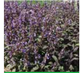
Salvia officinalis 'Purpurascens' Rotblättriger Salbei

Blüthenhöhe: 40 cm Blütezeit: Juni-Sept, R*