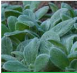
Stachys byzantina 'Silky Fleece' Matten-Woll-Ziest

Blüthenhöhe: 30-60 cm Blütezeit: Juni-Aug