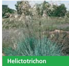
Helictotrichon sempervirens Wiesen-Blaustrahlhafer

Blüthenhöhe: 40-50 cm Blütezeit: Juli-Sept