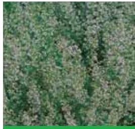
Calamintha nepeta ssp. nepeta Bergminze

Blüthenhöhe: 60-70 cm Blütezeit: Aug-Sept