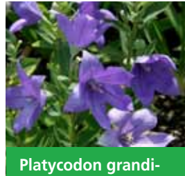
Platycodon grandiflorum 'Mariesii' Großblütige Ballonblume

Blüthenhöhe: 25-30 cm Blütezeit: Juni-Sept, R*