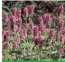
Stachys monnieri 'Hummelo' Dichtblütiger Ziest

Blüthenhöhe: 40-50 cm Blütezeit: Juli-Sept