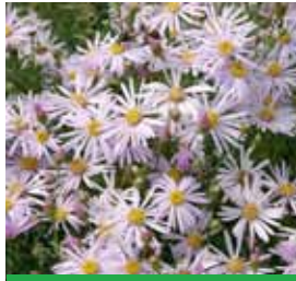
Aster pyrenaicus 'Lutetia' Pyrenäen-Aster

Blüthenhöhe: 60-70 cm Blütezeit: Aug-Sept