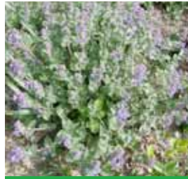
Nepeta x faassenii Katzenminze

Blüthenhöhe: 50-60 cm Blütezeit: Juni-Sept