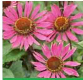
Echinacea purpurea 'Vintage Wine' -R- Schein-Sonnenhut

Blüthenhöhe: 30-50 cm Blütezeit: Juli-Sept, R*