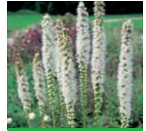
Liatris spicata 'Floristan Weiß' Prachtscharte