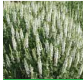
Salvia nemerosa 'Schneehügel' Weißer Blüten-Salbei

Blüthenhöhe: 40-60 cm Blütezeit: Juli-Aug