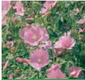
Malva moschata Moschus-Malve

Blüthenhöhe: 50-60 cm Blütezeit: Juni-Sept