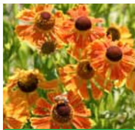
Helenium x cult. 'Waltraud' Sonnenbraut

Blütenhöhe: 90 cm Blütezeit: Juli-Sept, R*