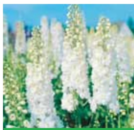
Delphinium Hybr. 'Galahad' Rittersporn

Blütenhöhe: 100-150 cm Blütezeit: Sept-Okt