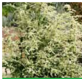
Artemisia lactiflora 'Elfenbein' China-Beifuß

Blütenhöhe: 100-150 cm Blütezeit: Sept-Okt