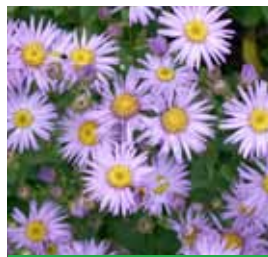
Aster amellus 'Glücksfund' Sommer-Aster