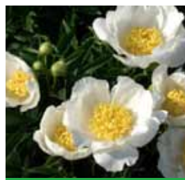
Paeonia lactiflora 'Jan van Leeuwen' Pfingstrose

Blütenhöhe: 60-70 cm Blütezeit: Juli-Sept