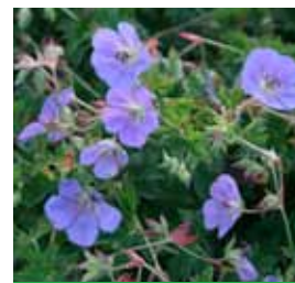
Geranium pratense 'Rozanne' -R- Storchschnabel

Blütenhöhe: 30-40 cm Blütezeit: April-Mai