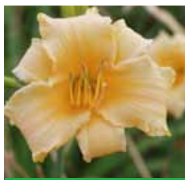
Hemerocallis x cult. 'Winnie the Pooh' Taglilie

Blütenhöhe: 60-70 cm Blütezeit: Juli-Sept