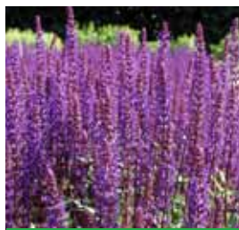
Salvia nemorosa 'Caradonna' Blüten-Salbei

Blütenhöhe: 90 cm Blütezeit: Juli-Sept, R*