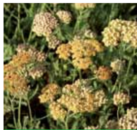
Achillea millefolium 'Terracotta' Schafgarbe

Blütenhöhe: 100 cm Blütezeit: Juli-Sept, R*