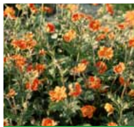
Geum coccineum 'Borisii' Nelkenwurz