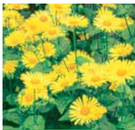
Doronicum orientale 'Leonardo' Gemswurz

Blütenhöhe: 30-40 cm Blütezeit: April-Mai