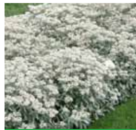
Anaphalis triplinervis 'Silberregen' Perlkörbchen

Blütenhöhe: 60-80 cm Blütezeit: Juni-Aug