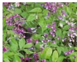
Lathyrus vernus Frühlingsplatterbse