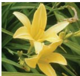
Hemerocallis x hybr. 'Bel' Taglilie