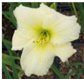
Hemerocallis x hybr. 'Hope Diamond' Taglilie