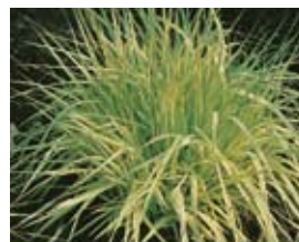
Molinia caerulea 'Variegata' Gestreiftes Pfeiffengras