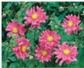
Anemone x japonica 'Prinz Heinrich' Japan-Herbst-Anemone