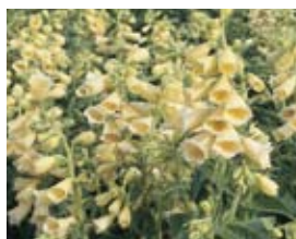
Digitalis grandiflora Großblütiger Fingerhut