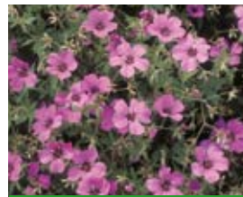
Geranium x psilostemon 'Patricia' Armenischer Storchschnabel