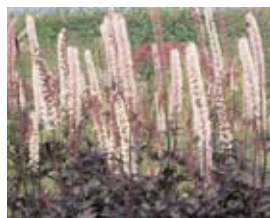
Cimicifuga simplex 'Brunette' September-Silberkerze

Blüthenhöhe: 50 cm Blütezeit: Jun-Aug, R*