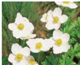
Anemone sylvestris Großes Wald-Windröschen