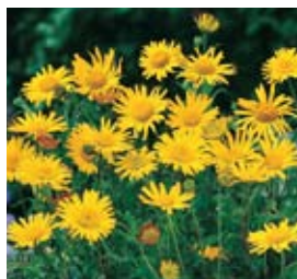
Bupthalmum salicifolium Goldmargerite

Blüthenhöhe: 50 cm Blütezeit: Jun-Aug, R*