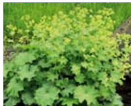
Alchemilla mollis Frauenmantel