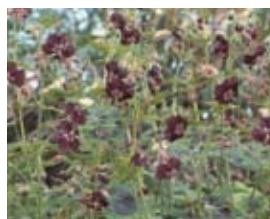
Geranium phaeum 'Samobor' Storchschnabel