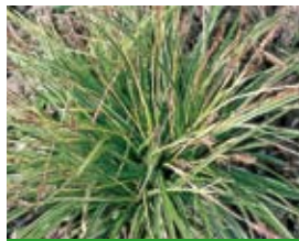
Carex morrowii 'Variegata' Weißgestreifte Japan-Segge