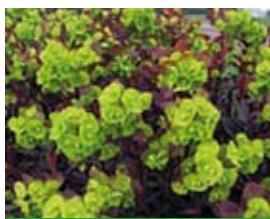
Euphorbia amygdaloides 'Purpurea' Purpur-Mandel-Wolfsmilch